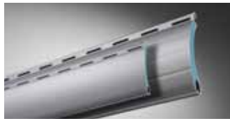
ALUMINO protect, doppelwandig, umweltfreundlich stabil hartgeschäumt

Die untenstehenden maximalen Breiten sind die konstruktiv möglichen Maße. Je nach Region können sich nach DIN EN 13659 (Windwiderstandsklassen) geringere Breiten ergeben.