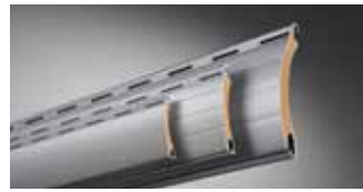
ALUMINO, doppelwandig, umweltfreundlich ausgeschäumt