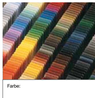
ROMA ColorCollection (Standard) oder andere Farben (Sonderfarben)